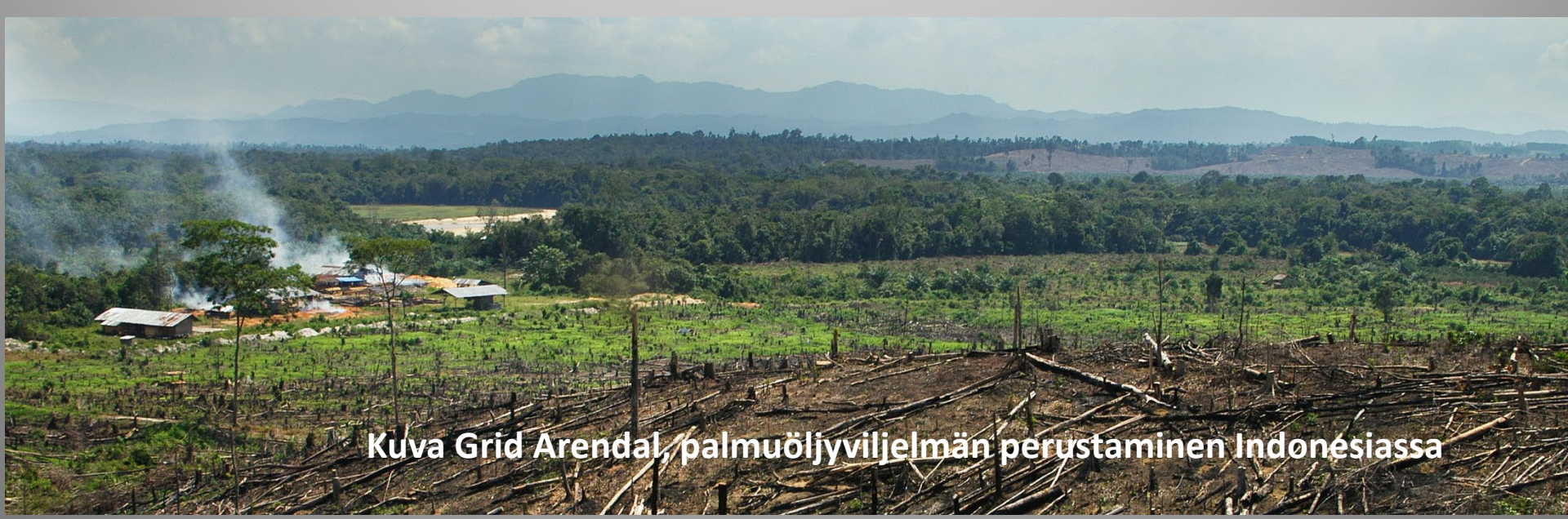
palmuöljyviljelmän perustaminen Indonesiassa