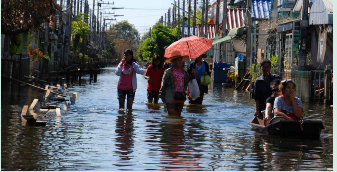
Asukkaat palaavat siivoamaan kotejaan tuhoisten tulvien jäljiltä Bangkokin esikaupunkialueella 2011.

Glasgow'n COP26-kokouksen aikana People's Summit for Climate Justice kokoaa kansalaisyhteiskunnan edustajia pohjoisesta ja etelästä vahvistamaan yhteisiä ilmastotoimia. Tapahtumaan voi osallistua myös etänä. Tervetuloa mukaan toimimaan!